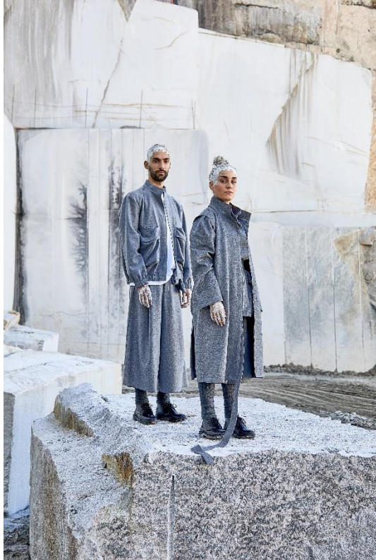
GRAY MATTER von Adrián González, Choreographie Esther Latorre, Hugo Pires Pereira (c) Hugo Pires Pereira

„Und auch mit denen, die aus verschiedenen Gründen nicht kommen können, sind wir in engem Kontakt. Für mich zeigt sich hier die Bedeutung und Wichtigkeit der internationalen Ausrichtung des Festivals: auch wenn sich Grenzen schließen und Netze unterbrochen werden, bietet es die Möglichkeit und eine Plattform, in Verbindung zu sein.“